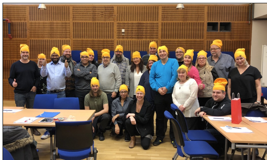
Ett härligt gäng LO-fackliga företrädare från våra kommuner i Stockholms län.